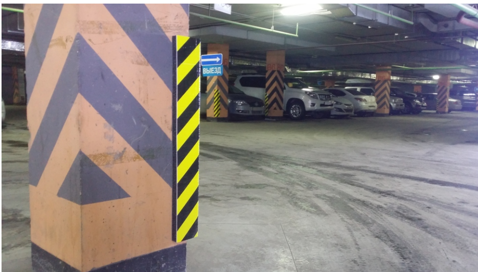
Пример исполнения защиты проездов общего пользования на паркинге ТРЦ