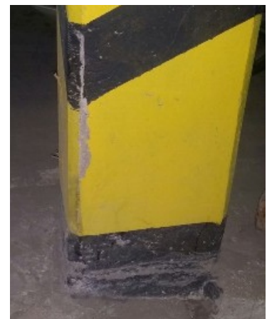
Колонны паркинга после типовых столкновений